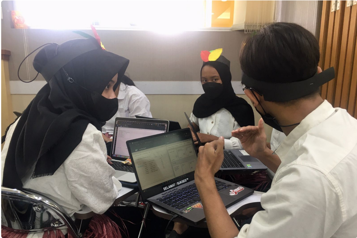
Suasana diskusi kelompok dalam Kompetisi Enterprise Simulation

Menariknya, tidak ada strategi yang mutlak untuk dapat memenangkan kompetisi ini. Setiap kelompok dibebaskan memilih strategi yang ingin mereka gunakan sesuai dengan yang telah diajarkan pada praktikum sebelumnya, seperti praktikum sales and distribution, production training, serta material management. "Pada praktikum yang terakhir ini, semua fungsi yang sudah dipelajari dikombinasikan," imbuh Mahasiswa DSI angkatan 2019 tersebut.